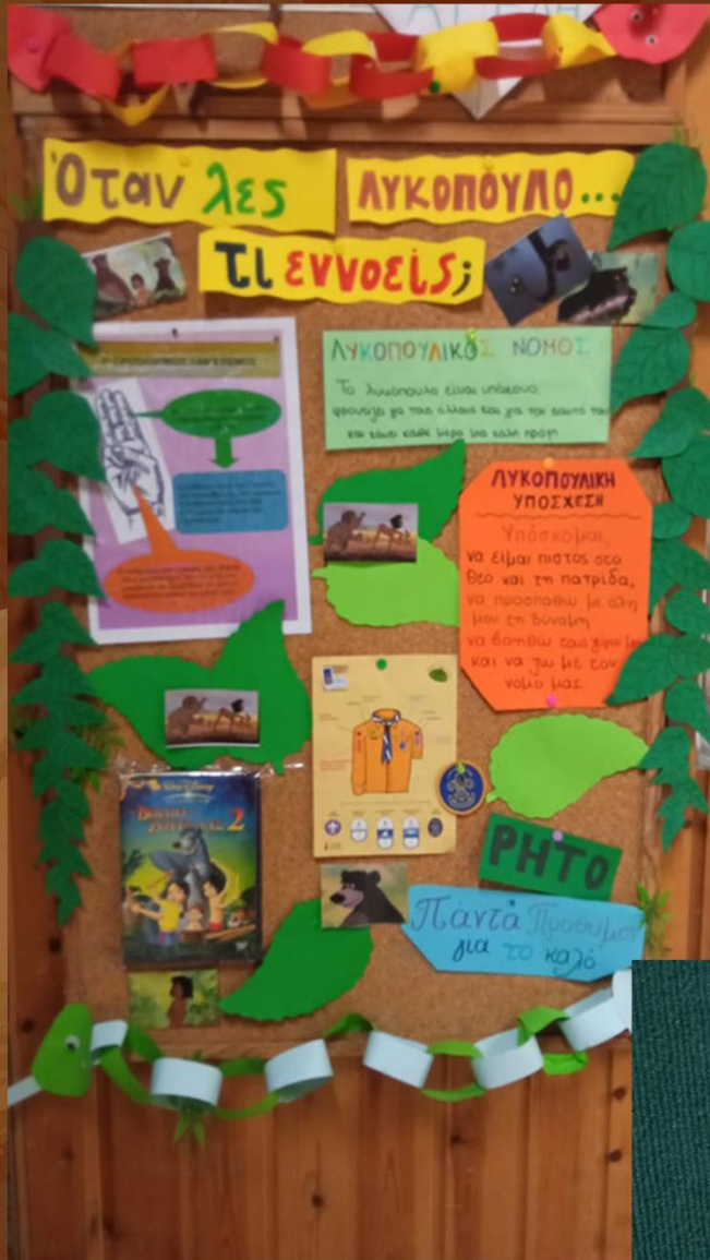
18ο Σύστημα Αθηνών