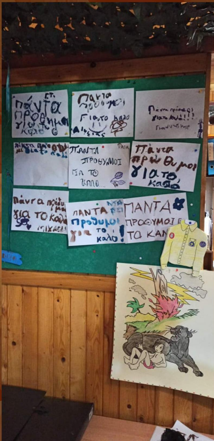
37ο Σύστημα Αθηνών